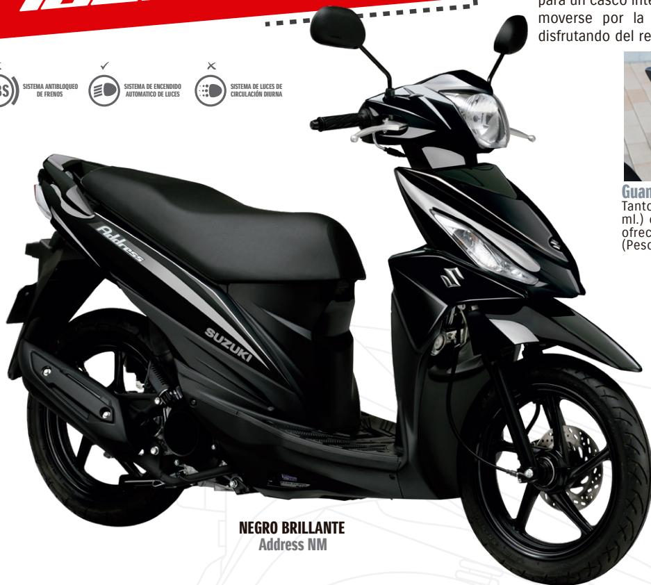
NEGRO BRILLANTE Address NM