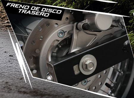
FRENO DE DISCO TRASERO