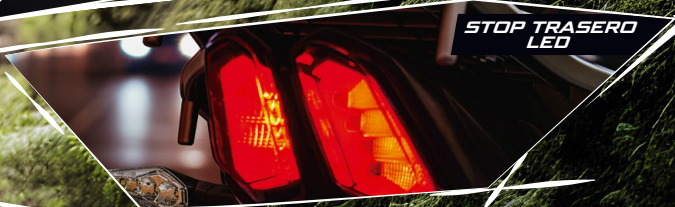
STOP TRASERO LED